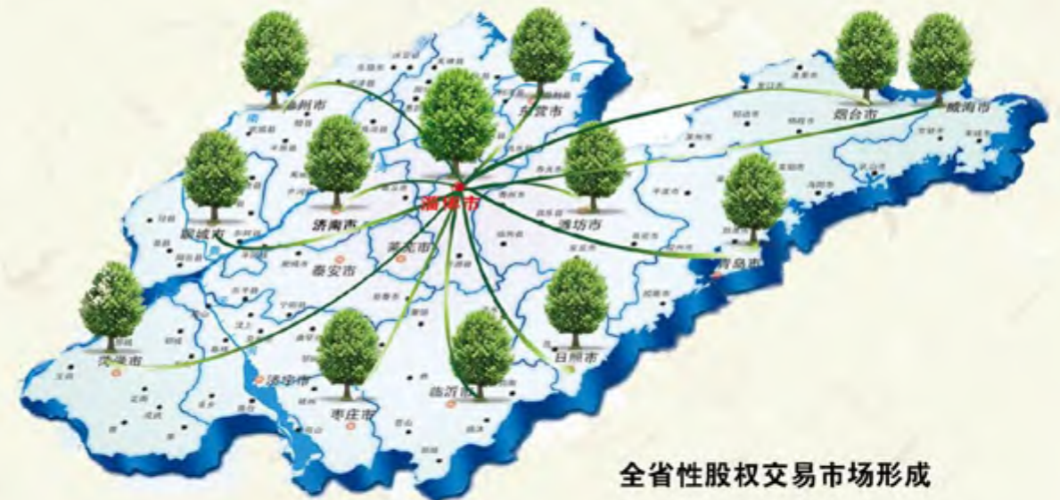
全省性股权交易市场形成

● 2011年11月，山东省政府发布了《关于金融支持山东半岛蓝色经济区发展的意见》（鲁政发[2011]50号），明确指出“探索建立统一监管下的服务于蓝色经济区的股权场外交易市场，开展未上市股份公司股份转让试点，推动齐鲁股权托管交易中心向山东半岛蓝色经济区扩大辐射面，积极探索创新，为建设全省性股权场外交易市场积累经验”。